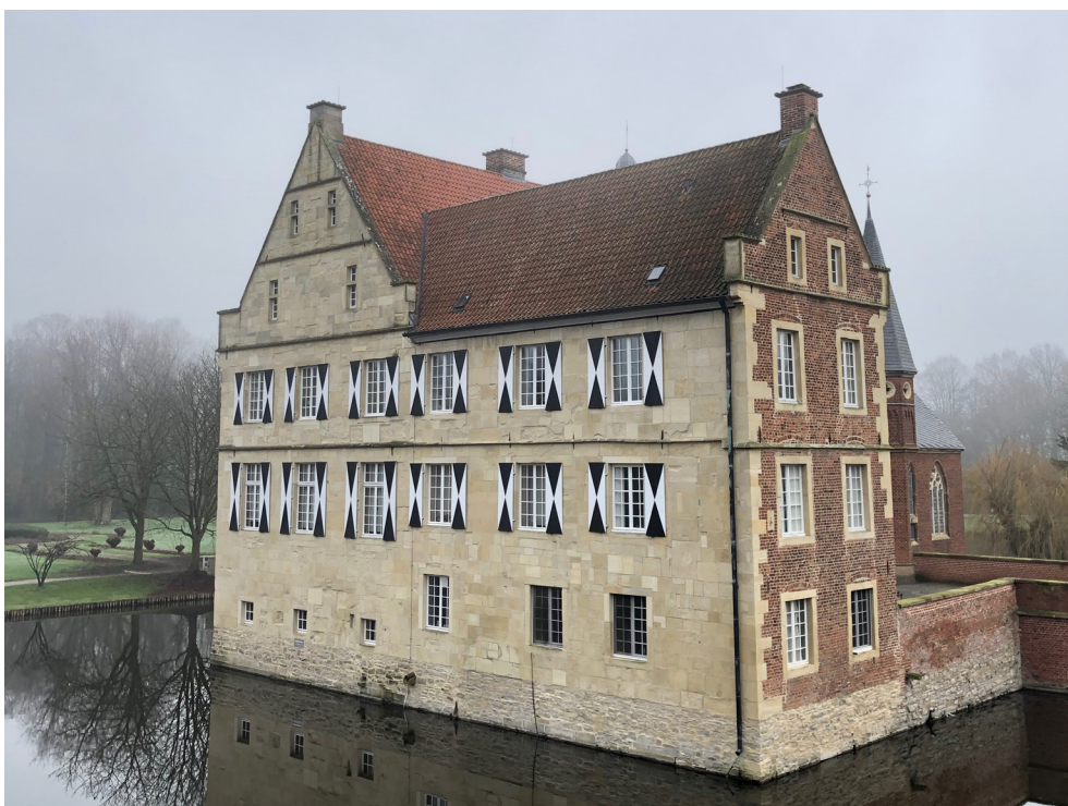
Haupthaus - Westansicht