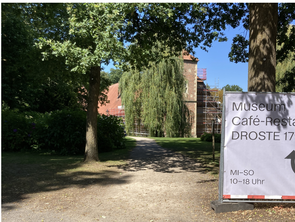
Denkmalgeschützte Parkanlage - Blick von Alte Schmiede