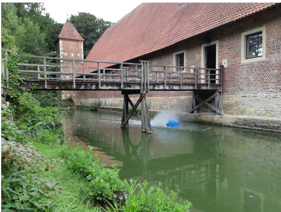
Denkmalgeschützte Parkanlage - Holzbrücke vor Torhaus