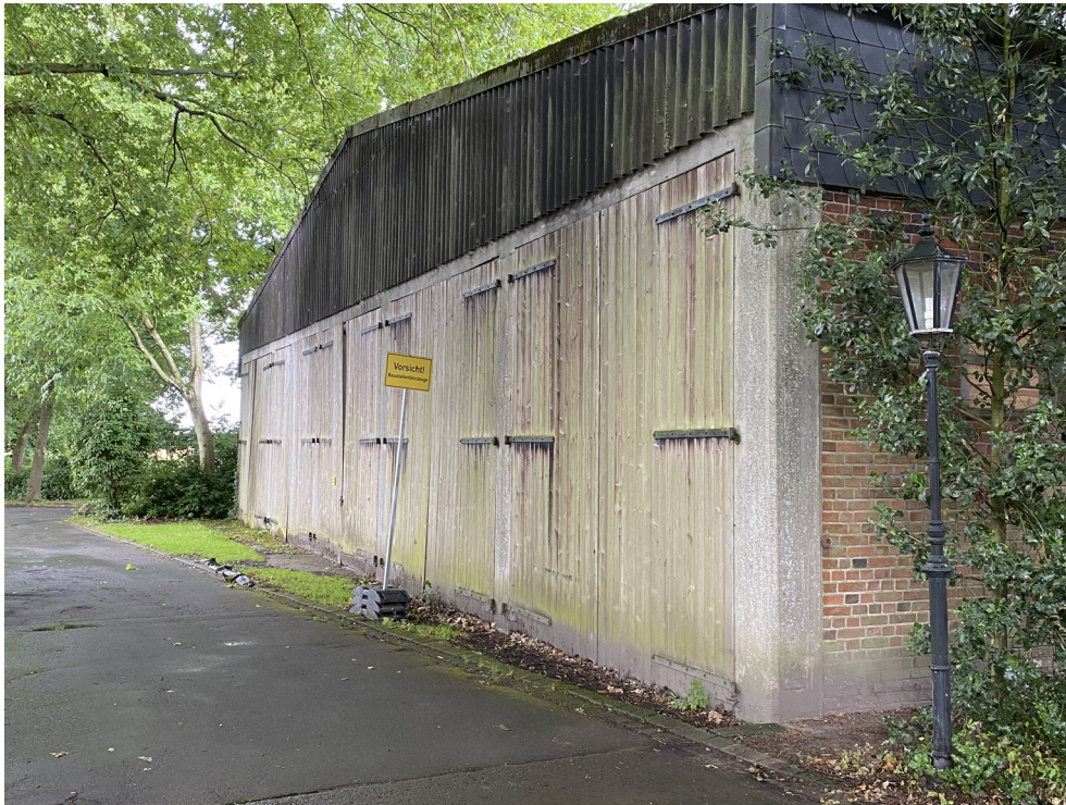
Heizzentrale - Ansicht Nord-West