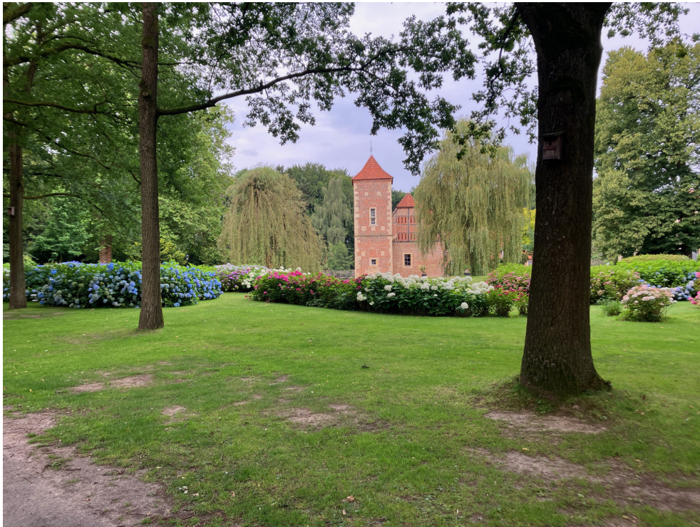
Denkmalgeschützte Parkanlage - Blick von Heizzentrale