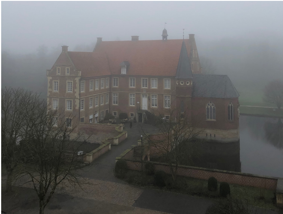
Haupthaus - Südansicht