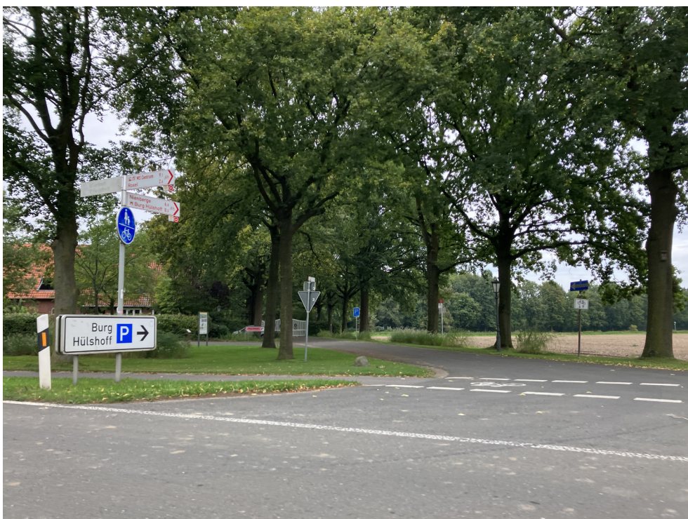
Einfahrt - Richtung Havixbeck