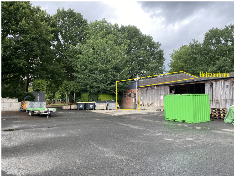
Heizzentrale - Hof Gärtnerei - Ansicht Süd-West