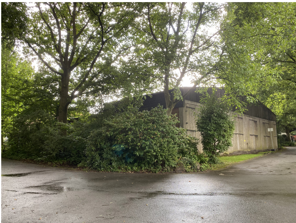
Heizzentrale - Ansicht Nord-West