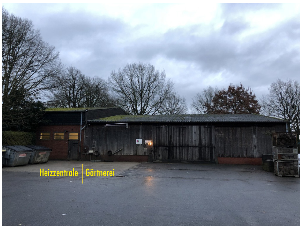
Heizzentrale - Hof Gärtnerei - Ansicht Süd-West